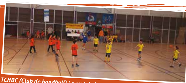
TCHBC (Club de handball) La nuit du hand – Des dizaines d'équipes se sont rencontrées