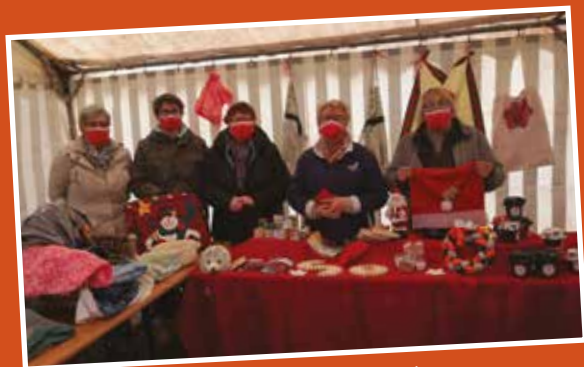
Tinténac créatif : des cadeaux de Noël qui ont fait le bonheur de petits et grands.