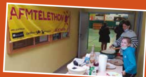
L'ASVHG Basket et Le FCTSD Match amicaux et buvettes au profit du téléthon