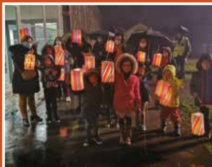
Familles rurales : Ouverture et clôture du téléthon : 30 enfants pour un défilé aux lampions.