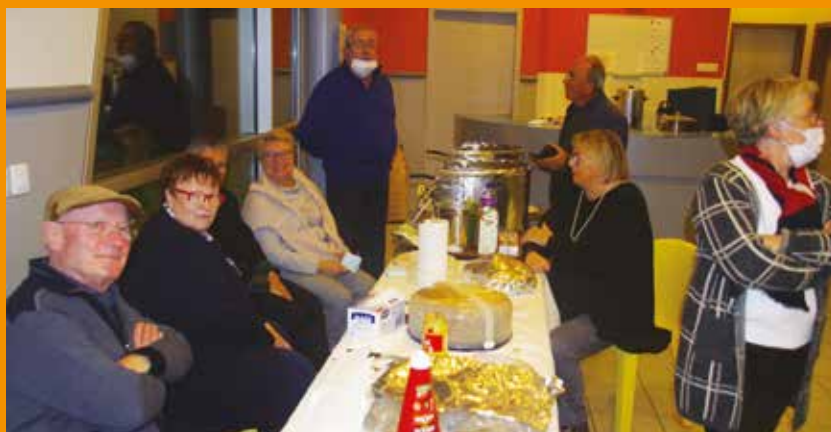
Une partie des bénévoles, au milieu de leurs multiples tâches, un peu de réconfort, avant de retourner au travail !