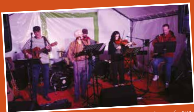
Les Bâbordais : Le joyeux équipage nous a embarqués sur toutes les mers.