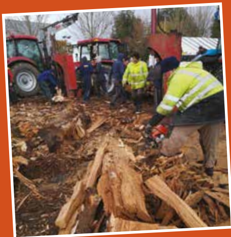
Tinté Agricœur : Le chantier bois : 29 cordes de bois débitées, fendues et livrées en moins de 48 heures.

3 e meilleure récolte du département. Découvrez en images toute l'énergie des actions associatives