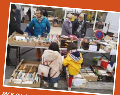
MCS (Maison de la culture et de la solidarité) : 200 livres d'occasion vendus.