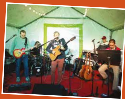
Les armoires blindées Joie et bonne humeur se répandent au fil des chansons.