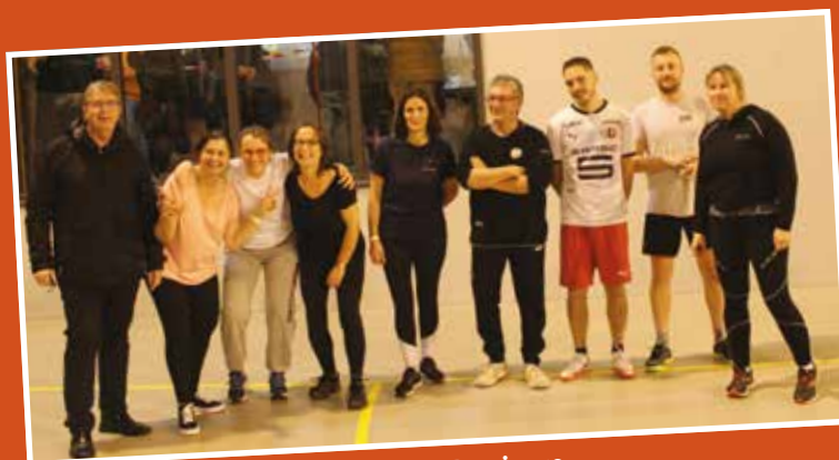
Match amical des élus Tinténac – St Domineuc