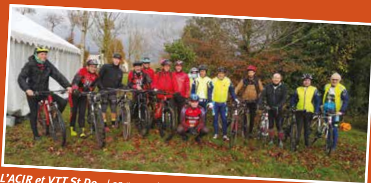
L'ACIR et VTT St Do - Les roues tournent sur des kilomètres, la recherche médicale avance.