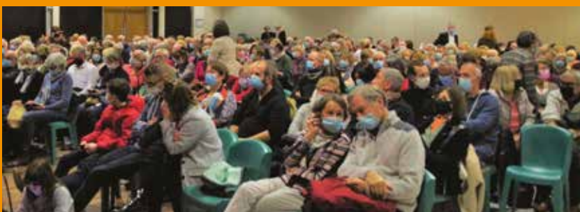
La salle ILLE ET DONAC, remplie de ses spectateurs, mais toujours dans le respect des gestes barrière.