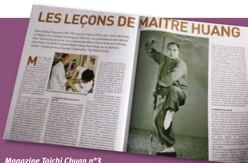
Magazine Taichi Chuan n°3 article traduit et communiqué par assodao

L e Taiji est un Art Martial Interne Chinois, créé il y a plus de 700 ans, inscrit depuis décembre 2020 sur la liste du patrimoine culturel immatériel de l'UNESCO.