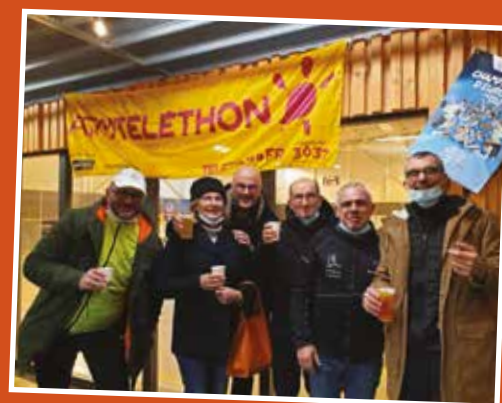
Courir et marcher à Tinténiaac – Québriac Beaucoup de pas pour ces sportifs, de grandes enjambées pour le téléthon