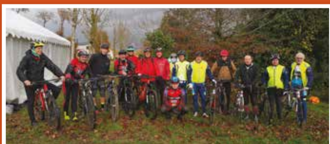
Le circuit à vélo - ACIR