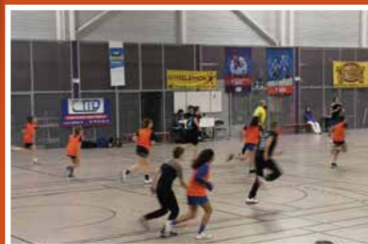
La nuit du hand - Tinténiac Combours Hand Ball Club