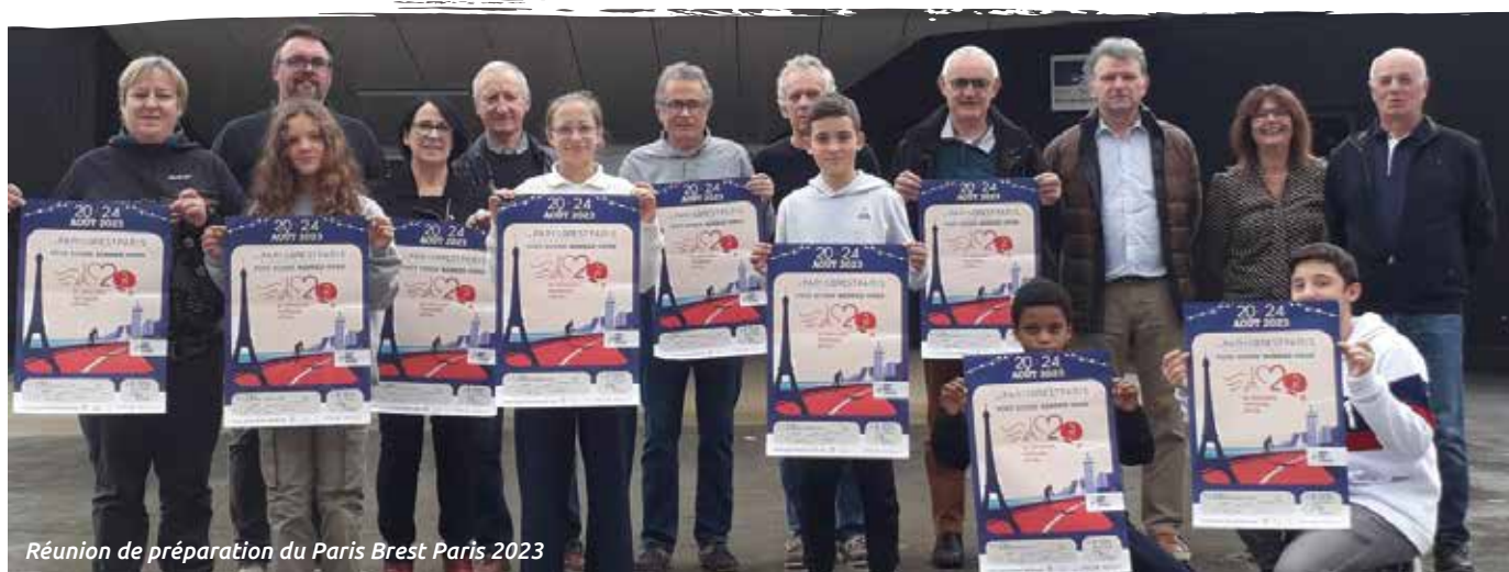
Réunion de préparation du Paris Brest Paris 2023