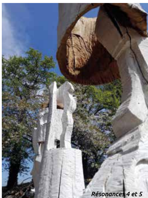
Résonances 4 et 5

C 'est en janvier 2015 que l'atelier B.Skult a pris vie au lieu-dit Cohier à Tinténac.