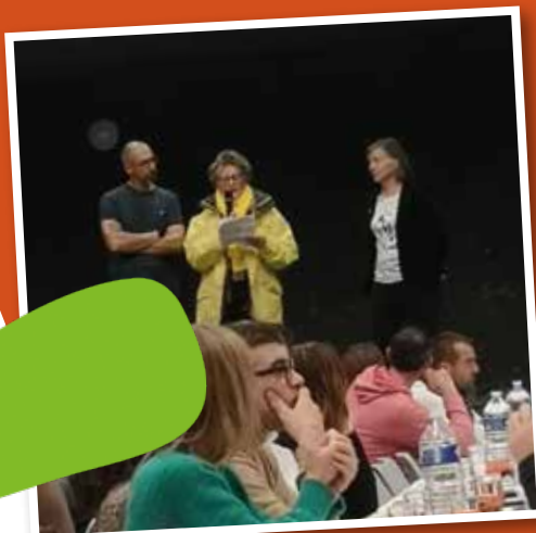
Le repas à St Domineuc