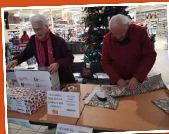
Emballage des cadeaux - Club du bon accueil