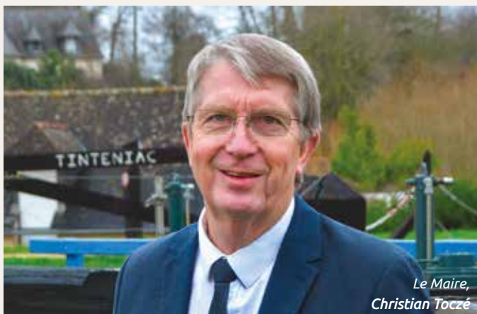
Le Maire, Christian Tocqué

Nous avons réalisé l'isolation de l'ex-syndicat d'initiative, Place Jean Provost, avec la réalisation d'un faux plafond et la création d'un chauffage aérothermique avec un groupe extérieur (13 744 €).