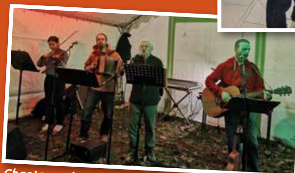
Chants marins - Les Bobordais