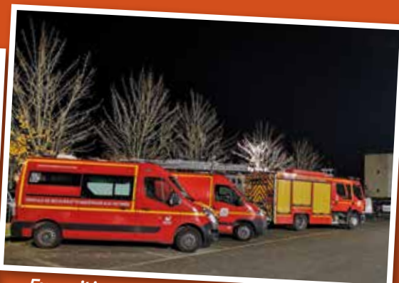
Exposition de véhicules - Sapeurs Pompiers