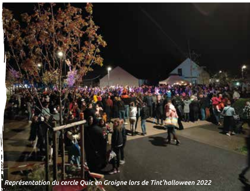
Représentation du cercle Quic en Groigne lors de Tint'halloween 2022