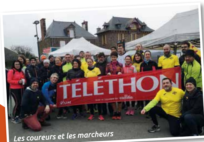
Les coureurs et les marcheurs