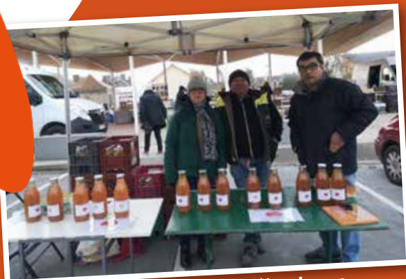
Vente de jus de pommes - Tinté'Agricœur