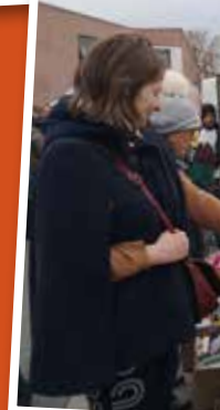
Vente de livres