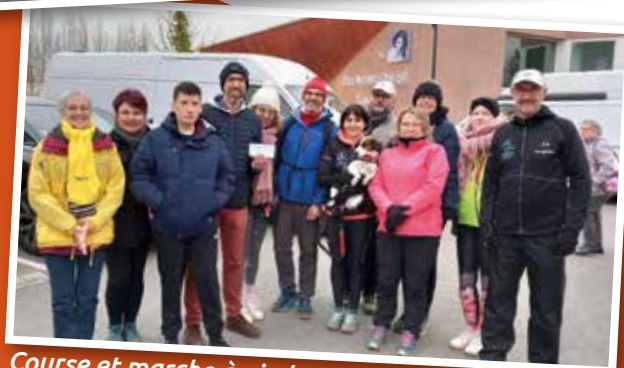
Course et marche à pied - Courir Marcher à Tinténiaac-Québriac