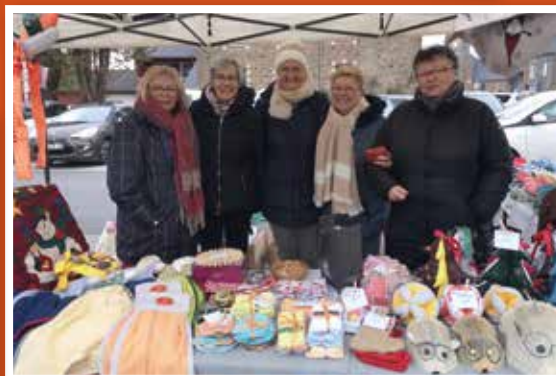
Vente de créations manuelles -Tinté'créatif