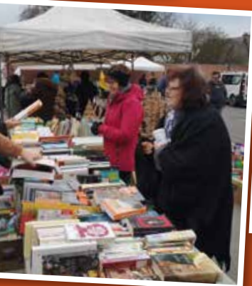
d'occasion - MCS